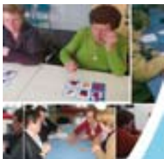
Escuela de Mayores: talleres de estimulación cognitiva y emocional