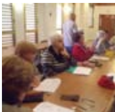
Taller de lectoescritura

El programa CALIDAD DE VIDA EN LAS PERSONAS MAYORES incluye actuaciones destinadas a prevenir situaciones propias del proceso de envejecimiento como el aislamiento, la pérdida de autonomía personal y social , el deterioro físico y cognitivo.